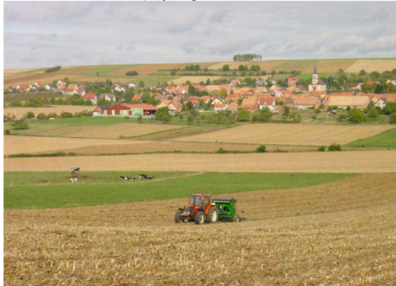
photothèque des Chambres d'agriculture

Pour 35% des Chambres d'agriculture qui ont répondu à l'enquête, un paysage contemporain de qualité est un paysage vivant et évolutif . Il ne s'agit pas de mettre le paysage sous cloche,